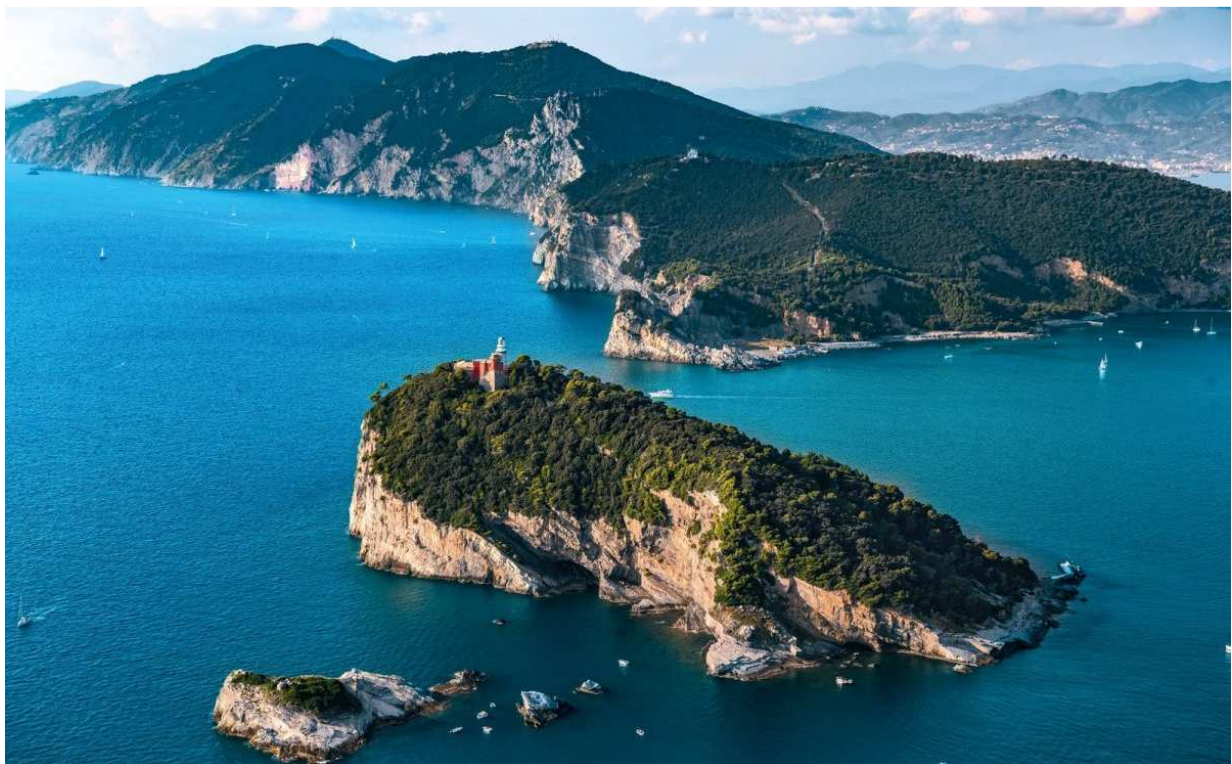
Isola Palmaria (Prov. La Spezia)