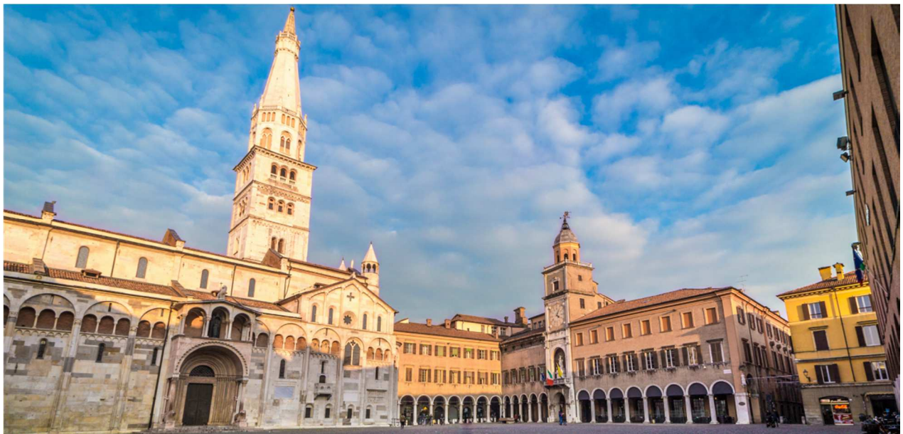
Complesso monumentale di Piazza Grande (Modena)