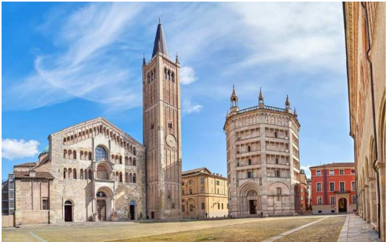
Piazza Duomo (Parma)